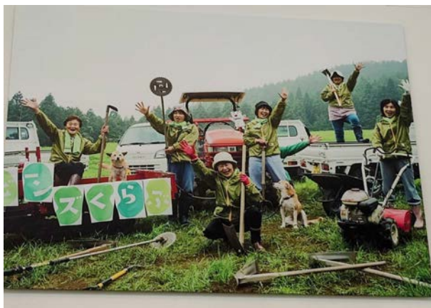
南三陸町ビーンズくらぶの皆様

「Yes 工房」では、オクトパス君の他にも皆さんが工夫して色々な物を作っておられ、目移りしてしまいました。お気に入りのは、「旅するかまぼこ」のポーチです。今回参加させていただいて、長年交流されてきた「ビーンズくらぶ」の皆さんや南三陸町の方々との強い絆を感じました。