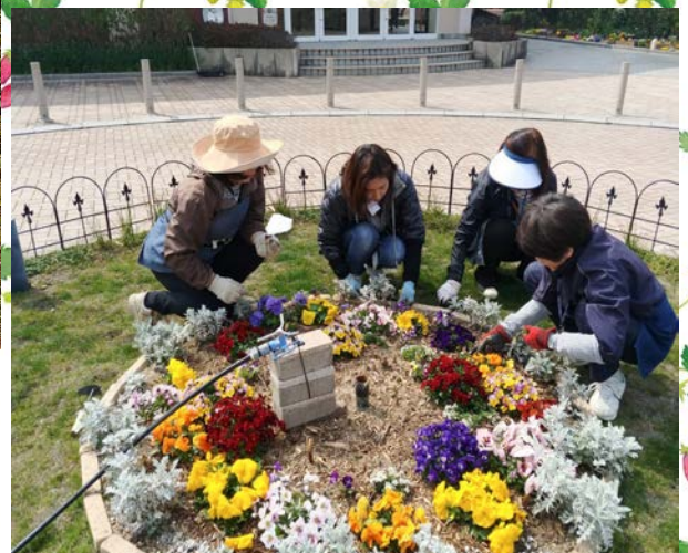
正門ロータリー内にて