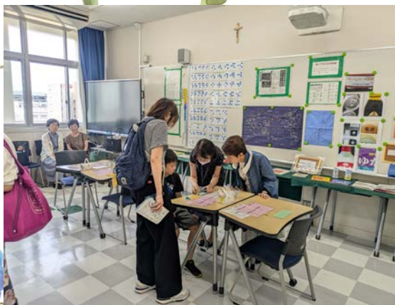
中高学祭にて点字体験学習