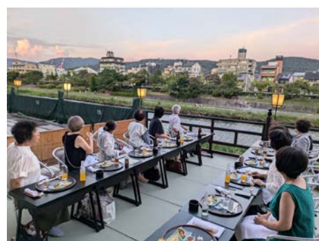
ビーンズくらぶの皆様と納涼床にて