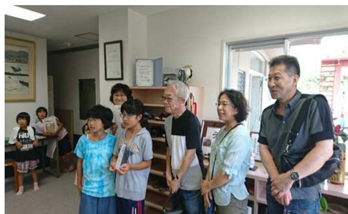
気仙沼市児童養護施設旭が丘学園にて