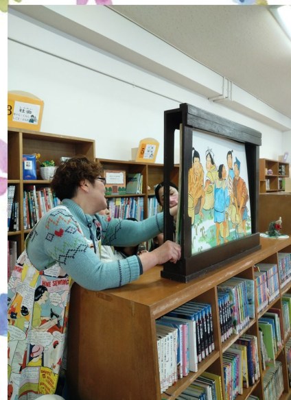
小学校にて紙芝居上演活動