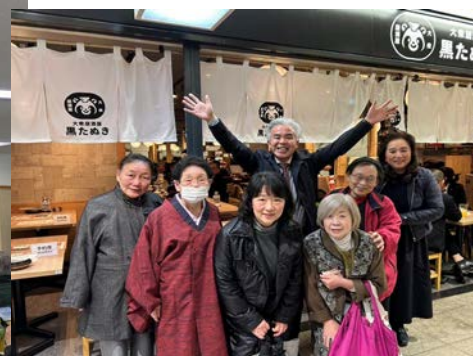
震災復興イベント懇親会にて