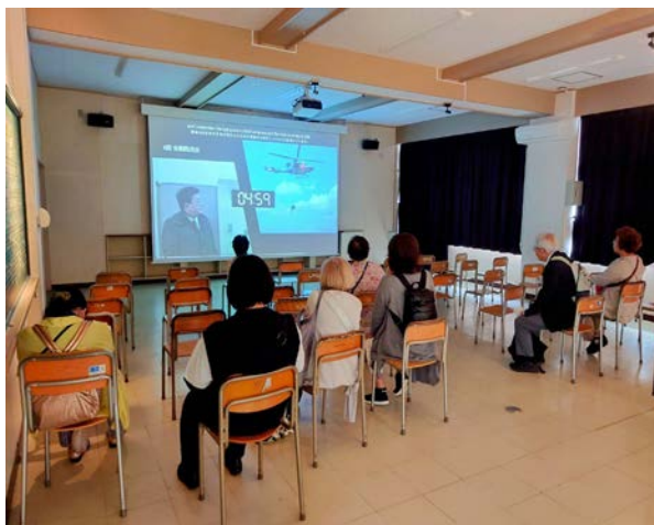
仙台市立荒浜小学校にて