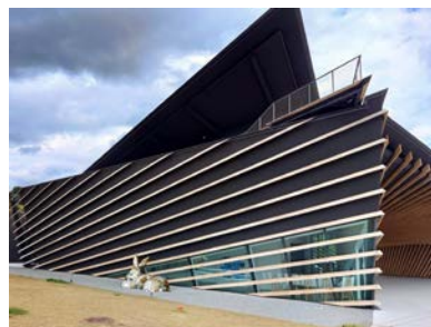
南三陸町防災対策庁舎