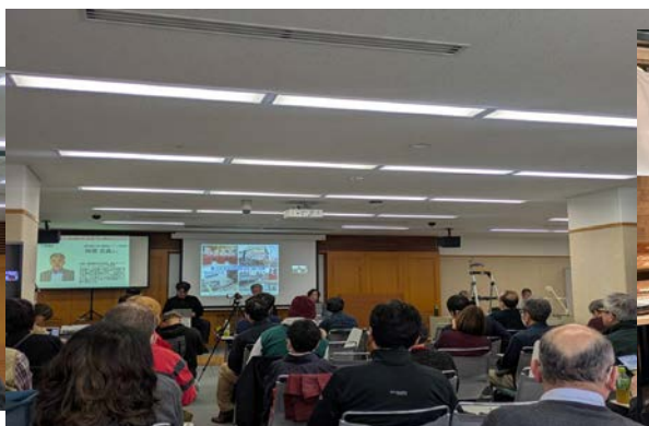
震災復興イベントにて