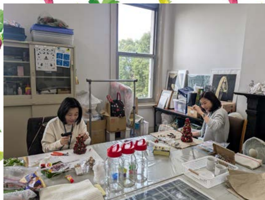
手作り品作製活動