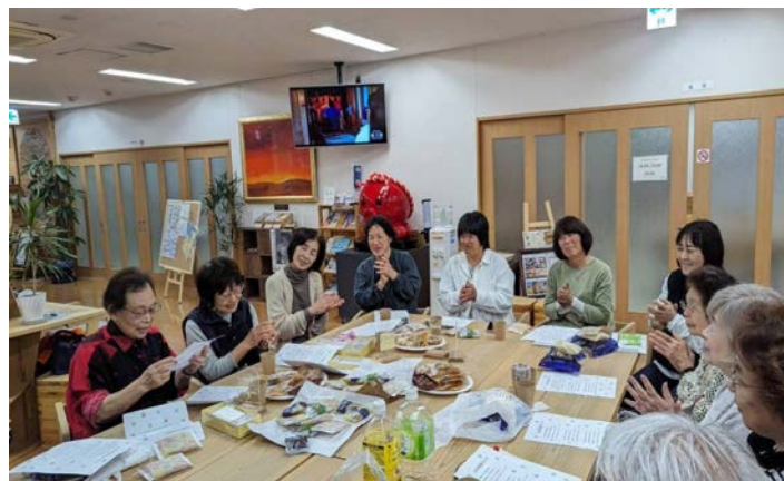
南三陸町「いりやど」にてビーンズくらぶの皆様と交流会