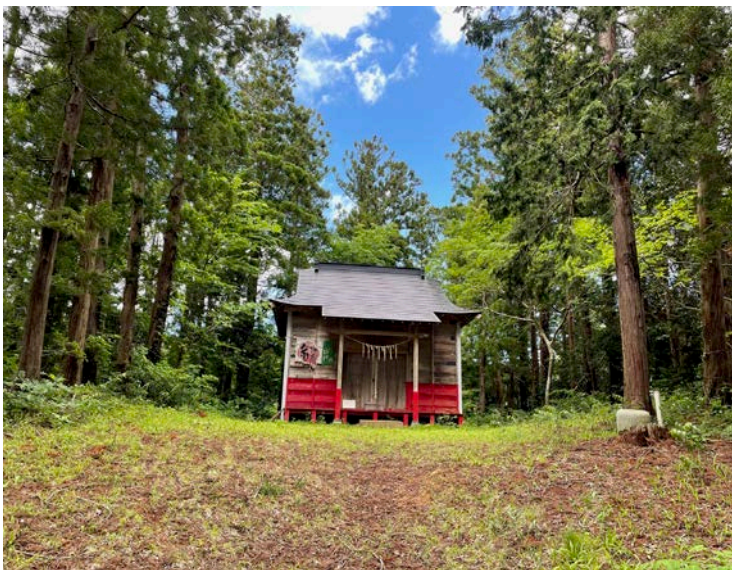
南三陸町 五十鈴神社

さらに、南三陸311メモリアルも訪れました。展示されていた震災の記録や証言、当時の遺物は、津波が奪ったものの大きさを物語っていました。そこには、悲しみとともに、地域の人々が伝え続けようとする「命の大切さ」への強い思いが込められていました。震災から学ぶことや、語り継ぐことの重要性を改めて実感しました。私自身もこの記憶を子供達そして孫達へと未来へつなげて伝えて行きたいと思いました。