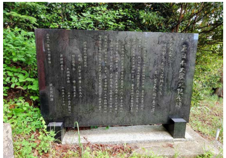
南三陸町五十鈴神社 石碑