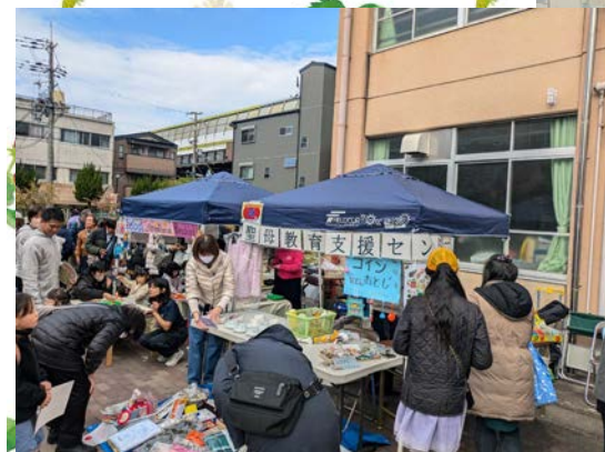
深草100円商店街にて