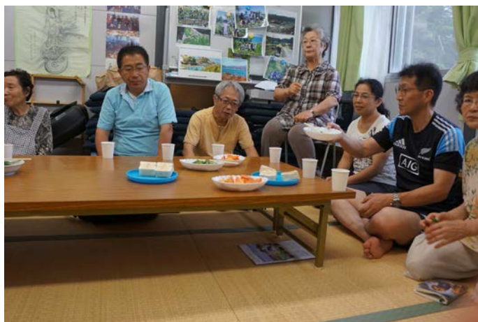
南三陸町波伝谷地区仮設住宅にて

各地で地震や災害が起こる度に南三陸町の事を思い出します。忘れられない、忘れてはいけない思い出です。