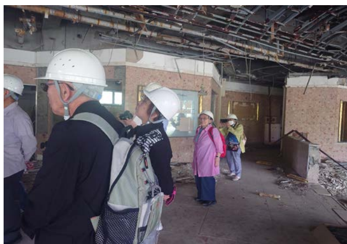
南三陸町高野会館にて