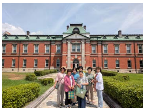
ビーンズくらぶ皆様と法人本館前にて

嬉しいことに、8月に、ビーンズくらぶのみなさまが、年に1度の小旅行に、京都を選んでくださり、お会いすることができました。学校を見ていただいた後、四条鴨川沿いの「鶴清」の納涼床でのお食事とお喋りで大盛り上がりでした