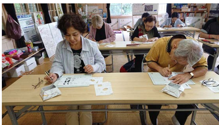
南三陸町にてきりこ体験