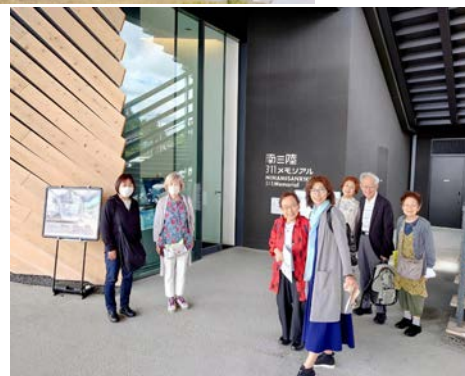
南三陸311メモリアルにて

伝承施設「南三陸 311 メモリアル」では、住民の証言映像を鑑賞してから、自然災害について学び合うラーニングプログラム「命を想う」に参加し参加者同士で考え話し合う事で、防災意識を高めることが出来ました。